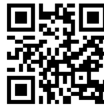
LV 250 MIC25002